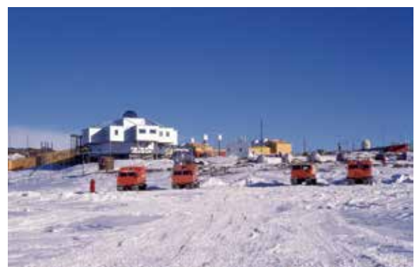
図2. 昭和基地主要部（1999年当時、現在も大きな変化はありません）